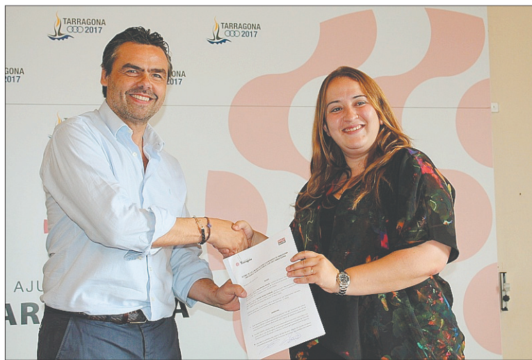
Imagen de la firma del convenio de colaboración.