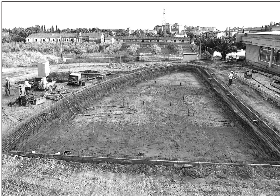
Un dels murs de la piscina que va fer caure el fort aiguat de dimarts.