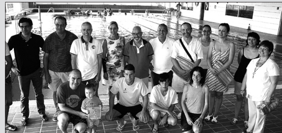
Edició de l'any passat.

REDACCIÓ. Valls serà, una vegada més, la seu central del Camp de Tarragona de la campanya «Mulla't per l'Esclerosi Múltiple 2014». En el marc d'aquesta activitat, la Fundació per l'Esclerosi Múltiple, en col·laboració amb l'Ajuntament de Valls i el Patronat d'Esports, organitza un sopar benèfic per recaptar fons per la mateixa Fundació. Al sopar, que es realitzarà el divendres, 4 de juliol, a les nou del vespre al Restaurant Masia Bou, hi assistiran representants de les entitats esportives de Valls, així com representants de les institucions locals, del món empresarial i associatiu de la ciutat.