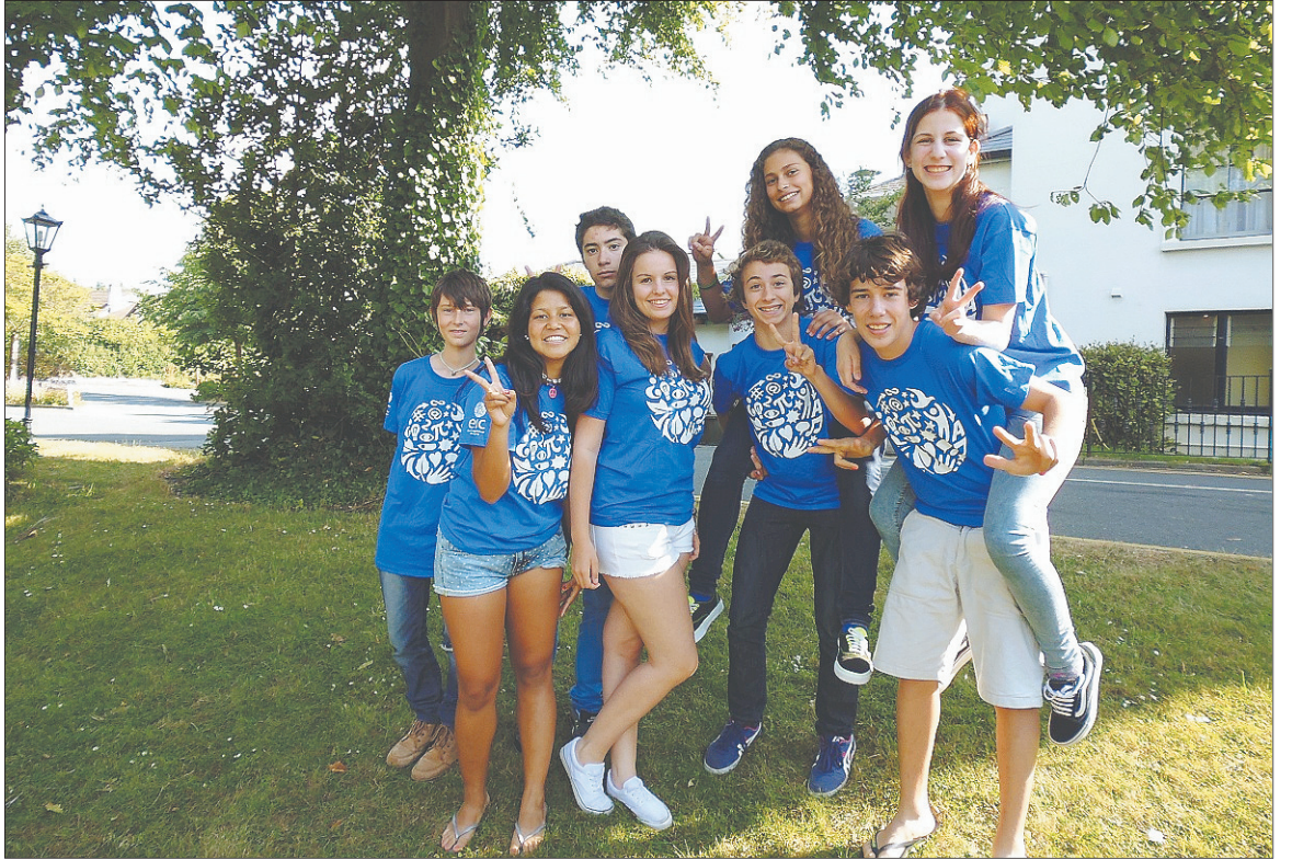
Los alumnos de la Escola Internacional del Camp estuvieron del 1 al 15 de julio en la capital de Irlanda.

fec festival, que tendrá lugar el 17 de agosto en la platja del Reguerreal. El segundo recibirá 100, y el tercero 50. Para inscribirse, los participantes debían ser mayores de 16 años, y tenían que subir una sesión en los portales web Soundcloud o Mixcloud. Luego se sometían al juicio del público a través del Facebook de la AMEC. Aún así, la última palabra la ha tenido el jurado. Todos los participantes tendrán una entrada doble para esta edición del Sunfec Cambrils. El certamen está organizado por el Ayuntamiento y la Asociación de música electrónica de Cambrils (AMEC).