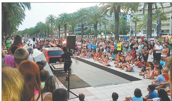
Los espectáculos se realizan en las calles de Salou.

tado perfectamente la formación que reciben durante todo el año en inglés, y también el factor cultural, la internacionalidad y la movilidad», apuntan desde la escuela de Salou.